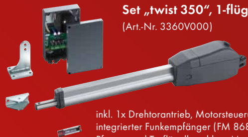
Set „twist 350“, 1-flügelig (Art.-Nr. 3360V000)

inkl. 1x Drehtorantrieb, Motorsteuerung im Gehäuse, integrierter Funkempfänger (FM 868,8 MHz), Pfosten- und Torflügelbeschlag, Montagematerial und 4-Befehl Handsender (Art.-Nr. 4020V000)