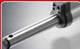
elektronische Endschalter mit Reed-Sensoren sorgen für präzise Endschaltung