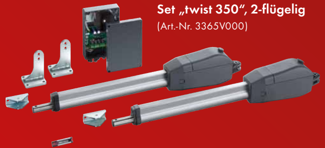
Set „twist 350“, 2-flügelig (Art.-Nr. 3365V000)

inkl. 1x Drehtorantrieb, Motorsteuerung im Gehäuse, integrierter Funkempfänger (FM 868,8 MHz), Pfosten- und Torflügelbeschlag, Montagematerial und 4-Befehl Handsender (Art.-Nr. 4020V000)