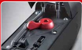
sicheres und komfortables Notentriegelungssystem; kein Werkzeug notwendig