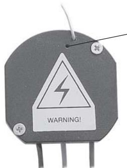
Funklichtschalter RRL 433

DEL-Löschtaste (z.B. mittels Büroklammer aktivierbar)